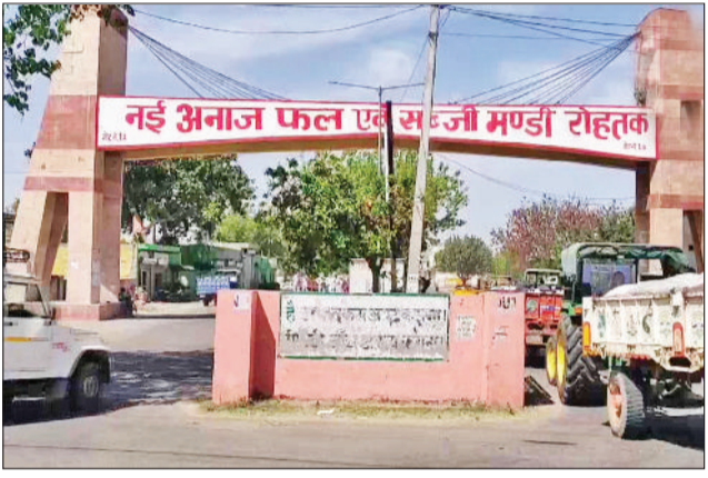
नई अनाज फल एवं सब्जी मण्डी रोहताक

20 प्रतिशत तक पहुंची नमी कृषि विशेषज्ञों के अनुसार, लगातार नमी और खेतों में पानी रुकने के कारण गेहूँ में नमी का स्तर बढ़कर 16 से 20 प्रतिशत तक पहुंच गया है। जबकि सरकारी खरीद के लिए तय मानकों के मुताबिक गेहूँ में अधिकतम 12 प्रतिशत नमी ही स्वीकार्य है। इससे अधिक नमी वाले अनाज को या तो रिजेक्ट किया जाता है या कटौती के साथ खरीदा जाता है। नमी बढ़ने से गेहूँ का दाना काला पड़ रहा है और उसकी चमक व वजन भी प्रभावित हो रहा है, जिससे किसानों को नुकसान उठाना पड़ रहा है। मंडियों में यही वजह है कि बड़ी मात्रा में फसल पहुंचने के बावजूद खरीद प्रक्रिया धीमी पड़ी है। मौसम साफ होने और पृष्ठ निकलने के बाद ही नमी में कमी आएगी, तब जाकर खरीद में तेजी संभव है, ये विशेषज्ञों का कहना है।