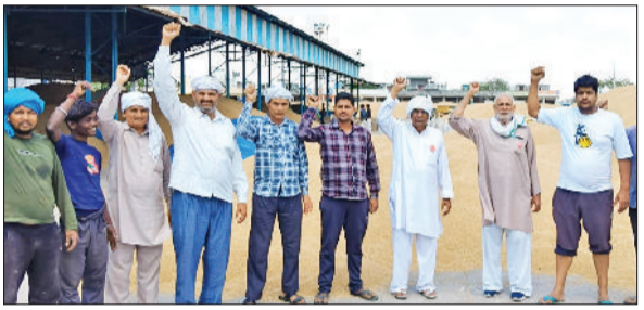
खरीद नहीं, किसानों पर आर्थिक दबाव