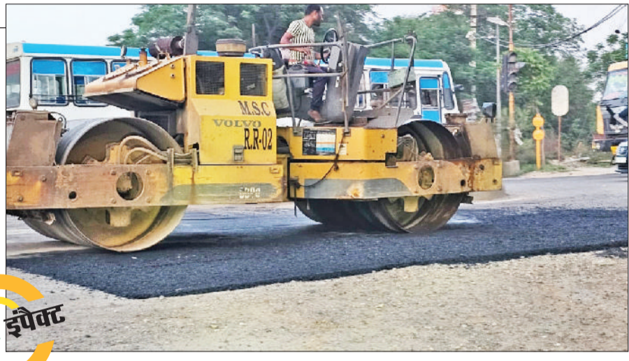
लंबे समय से बहाल पड़ी नया बस अड्डा से वीटा प्लांट तक की सड़क आखिरकार प्रशासन की नजर में आ ही गई। वर्षों से गहरे गड्ढों और टूटी सड़क के कारण परेशान हो रहे वाहन चालकों और स्थानीय लोगों को अब बड़ी राहत मिली है। हरिभूमि द्वारा इस समस्या को प्रमुखता से उठाने के बाद प्रशासन हरकत में आया और सड़क की मरम्मत का कार्य शुरू करवाया गया। इस मार्ग पर रोजाना हजारों वाहनों का आवागमन होता है। दिल्ली, चंडीगढ़, जींद, भिवानी, हिसार और

हरिभूमि न्यूज ▶▶ रोहतक लंबे समय से बहाल पड़ी नया बस अड्डा से वीटा प्लांट तक की सड़क आखिरकार प्रशासन की नजर में आ ही गई। वर्षों से गहरे गड्ढों और टूटी सड़क के कारण परेशान हो रहे वाहन चालकों और स्थानीय लोगों को अब बड़ी राहत मिली है। हरिभूमि द्वारा इस समस्या को प्रमुखता से उठाने के बाद प्रशासन हरकत में आया और सड़क की मरम्मत का कार्य शुरू करवाया गया। इस मार्ग पर रोजाना हजारों वाहनों का आवागमन होता है। दिल्ली, चंडीगढ़, जींद, भिवानी, हिसार और