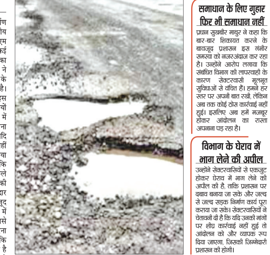
सेक्टर-4 एक्सटेंशन में सड़क निर्माण कार्य में लगातार देरी देरी से स्थानीय निवासी अब आक्रोशित हो गए हैं। सीएम विडो, मुख्यमंत्री और उपायुक्त को कई बार शिकायत देने के बावजूद समस्या का समाधान नहीं होने पर सेक्टरवासियों ने अब हरियाणा शहरी विकास प्राधिकरण के खिलाफ मोर्चा खोलने का निर्णय लिया है।

हरिभूमि न्यूज ▶▶ रोहतक सेक्टर-4 एक्सटेंशन में सड़क निर्माण कार्य में लगातार देरी देरी से स्थानीय निवासी अब आक्रोशित हो गए हैं। सीएम विडो, मुख्यमंत्री और उपायुक्त को कई बार शिकायत देने के बावजूद समस्या का समाधान नहीं होने पर सेक्टरवासियों ने अब हरियाणा शहरी विकास प्राधिकरण के खिलाफ मोर्चा खोलने का निर्णय लिया है।