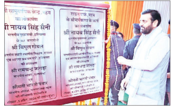
महम। विकास परियोजनाओं का उद्घाटन-शिलान्यास करते एवं विकास रैली को संबोधित करते मुख्यमंत्री नायब सिंह सैनी।

मुख्यमंत्री नायब सिंह सैनी ने कहा कि विपक्ष के पास कोई मुद्दा नहीं है, अब किसानों को खरीद के नाम पर गुमराह किया जा रहा है। इनके समय में जो भ्रष्टाचार चलता था, वो दुकाने अब बंद हो गई हैं तो इन्हें दर्द हो रहा है, लेकिन मैं, प्रदेश के किसानों को विश्वास दिलाता हूँ कि किसानों का एक एक दाना खरीदा जाएगा। मुख्यमंत्री रविवार को महम में आयोजित धन्यवाद एवं विकास रैली को संबोधित कर रहे थे। इस दौरान सीएम ने 202 करोड़ 77 लाख रुपये लागत की विकास परियोजनाओं के उद्घाटन एवं शिलान्यास किए हैं। मुख्यमंत्री ने हलके के विकास के लिए 10 करोड़ रुपये देने की भी घोषणा की, साथ ही रैली संयोजक एवं राज्यसभा सांसद रामचंद्र जांगड़ा द्वारा रखे गए मांग पत्र की सभी मांगों का अवलोकन करवाने उपरांत लागू करवाने का आश्वासन भी दिया। सीएम ने अपने संबोधन में कहा कि महम की धरती हरियाणा के ऐतिहासिक और सांस्कृतिक मानचित्र पर विशेष स्थान रखती है।