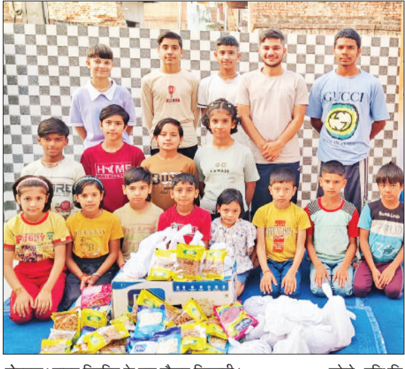
रोहतक। डाइट वितरित के बाद मौजूद खिलाड़ी।